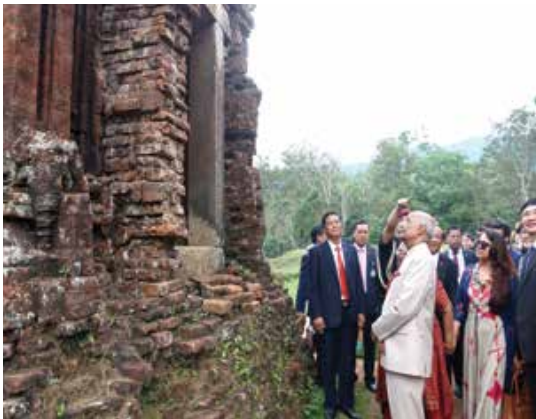
Indian President visited Thanh Dia My Son (My Son Sanctuary) during his state visit to Viet Nam in 2018.

I understand the earliest excavated artifacts in Viet Nam connected to Hindu culture and civilization of India is of the time period of 8th century AD. During my visits to Oc Eo Cultural Site in An Giang province and Cat Tien Archaeological Site in Lam Dong province, I was surprised to see a large number of ancient images and artifacts signifying a very strong ancient relationship existing between India and Viet Nam. I am aware that there are more mounds and places to be excavated in both places. It will be interesting to cooperate for further excavation and preserve these significant values for the present and future generations to understand the close connection between two ancient countries. In December, 2022, a conservation project was completed in My Son Sanctuary in Quang Nam province with cooperation of India (Archaeological Survey of India - ASI) and I am sure these intangible heritages will bring more tourists not only from India but also from other parts of the world to see the shared heritage and arts of both countries.