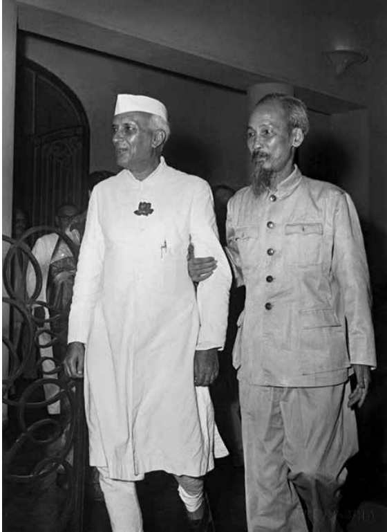
Chủ tịch Hồ Chí Minh đến thăm Ấn Độ dưới thời Tổng thống Rajendra Prasad.