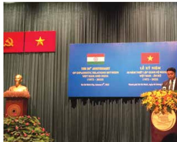
Tổng Lãnh sự Ấn Độ phát biểu tại Buổi Lễ Kỷ niệm 50 năm quan hệ ngoại giao Việt Nam - Ấn Độ tại TPHCM vào tháng 1 năm 2022.

Quả thật không thể tin được từ một ý tưởng nhỏ tổ chức Lễ hội Namaste Việt Nam năm 2022, sự kiện do Tổng Lãnh sự quán Ấn Độ tại TPHCM thực hiện đã tạo ra được một sức ảnh hưởng lớn đến truyền thông phương Tây và đã được đưa tin ở diện rộng. Sự kiện đã tạo ra nhiều sự tò mò của du khách Ấn Độ và mong