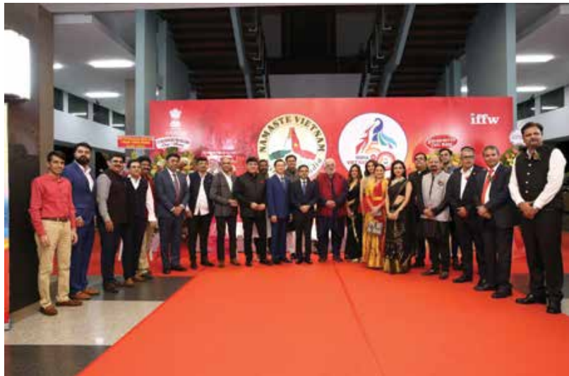
The Opening Ceremony of the Namaste Festival 2022 in Viet Nam.

promoting this fantastic engagement between the people and entrepreneurs of both sides.