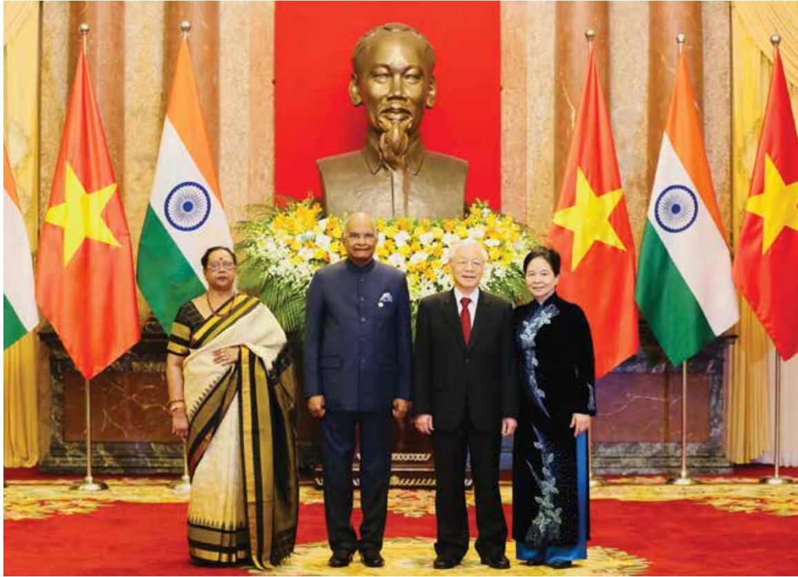
General Secretary Nguyen Phu Trong welcomed the Indian President for his state visit to Viet Nam in 2018.