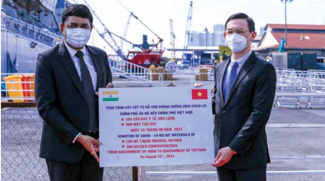
Indian CG in HCMC and DER DG in HCMC at the coronavirus medical equipment donation event during the fourth wave of COVID-19 in 2021.

How is the friendship level between India and Viet Nam on the back of realignment in relations by countries due to COVID-19 and global issues? Is it really so deep? Yes, the relationship and trust between India and Viet Nam goes beyond convention. In early 2020, when the COVID-19 pandemic suddenly forced every country to close its borders, India received with warmth Viet Nam citizens stuck in other countries to India and later facilitated their travels back to the homeland, Viet Nam. The crisis brought the people of Viet Nam pooling resources in form of masks, sanitizers, oxygen concentrators in large quantities for sending to India and India also came forward when the same unfortunate situation was faced by Ho Chi Minh City in May 2021. Still, the photos of candle lighting by Buddhist nuns and prayers by monks in Viet Nam for the well-being of India are etched in our minds.