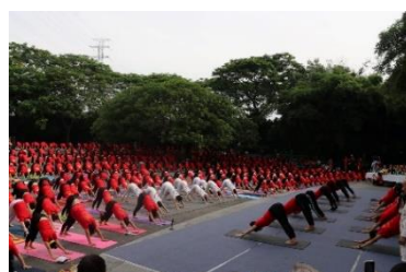
(Công viên Yên Sở, Hà Nội)