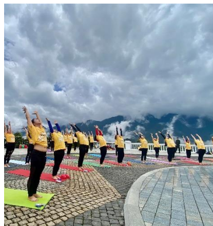
(Sapa, tỉnh Lào Cai)