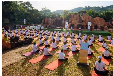
(Mỹ Sơn, Di sản Văn hóa Thế giới UNESCO)

Trong gần hai năm qua, do tình hình đại dịch, Đại sứ quán Ấn Độ hầu như chỉ quảng bá Yoga và các hoạt động liên quan đến Yoga theo hình thức trực tuyến. Năm nay, khi tình hình đã trở lại bình thường, Đại sứ quán quay lại tổ chức kỷ niệm Ngày Quốc tế Yoga theo hình thức trực tiếp. Sự kiện "mở màn" đầu tiên của chúng tôi trong năm nay theo chủ đề "Yoga vì nhân loại" được tổ chức vào ngày 29 tháng 5 tại chùa Tam Chúc, tỉnh Hà Nam với sự phối hợp của Giáo hội Phật giáo Việt Nam. Đại sứ quán sau đó tiếp tục tổ chức sự kiện tại tám tỉnh thành khác nữa của Việt Nam, bao gồm Hà Nội, Đà Nẵng, Vĩnh Phúc, Thanh Hóa, Quảng Ninh, Lào Cai, Thừa Thiên-Huế và Quảng Nam. Trong đó, nhiều nơi đã tổ chức sự kiện tại các địa điểm mang tính biểu tượng của Việt Nam. Tổng lãnh sự quán TP.HCM cũng tổ chức sự kiện tại 15 tỉnh thành phía Nam.