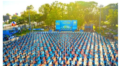
(Tỉnh Thừa Thiên-Huế)