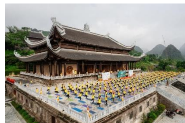
(Chùa Tam Chúc)