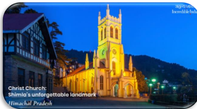
Christ Church: Shimla's unforgettable landmark Himachal Pradesh

Bao bọc trong sương mù, ẩn mình trong những khu rừng rậm rạp và nổi bật trên nền những đỉnh núi tuyết của dãy Himalaya hùng vĩ, Shimla là một thiên đường trên những ngọn đồi. Từ những ngôi nhà nghỉ có từ thời thuộc địa Anh đưa bạn trở về thế giới cũ cho đến khu Ridge nhộn nhịp dài 12km, trái tim của thành phố, Shimla, ở bang Himachal Pradesh, là một trong những nhà ga trên đồi nổi tiếng nhất ở Ấn Độ. Được bao quanh bởi dãy ngọn đồi cao vút, Shimla là một điểm đến lý tưởng vào kỳ nghỉ hè và nổi tiếng không kém vào mùa đông, khi được bao phủ bởi một lớp tuyết ở khắp nơi. Một nơi nghỉ dưỡng lý tưởng để trải nghiệm các môn thể thao cảm giác mạnh và kích thích adrenaline như trượt tuyết, đi bộ xuyên rừng, bay dù lượn và trượt băng. Bảo tồn gần như hoàn hảo các di sản, là thủ đô mùa hè đầu tiên của người Anh ở Ấn Độ, Shimla được tô điểm bởi các ngôi nhà gỗ bungalow phong cách thuộc địa và cũng được biết đến là nơi nghỉ dưỡng chính thức của Tổng thống Ấn Độ.